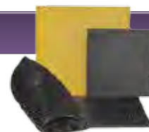
Type 1 EA300