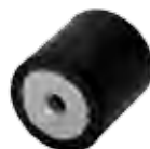
TYPE HS 1 SEUL TARAUDAGE