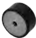
TYPE H TARAUDAGE 2 CÔTÉS